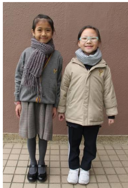
可加穿灰色背心(配有校徽)、 灰色外套(配有校徽)或灰色頸巾