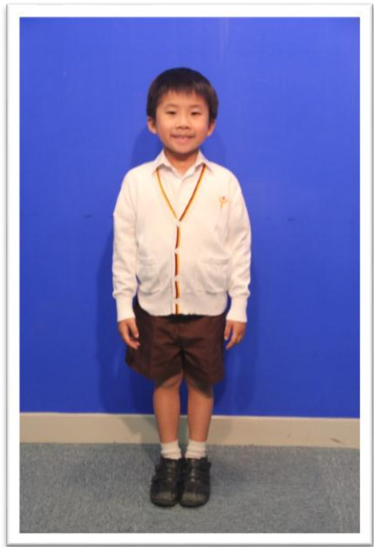
白色冷氣褸(配有校徽) 只可配夏季校服