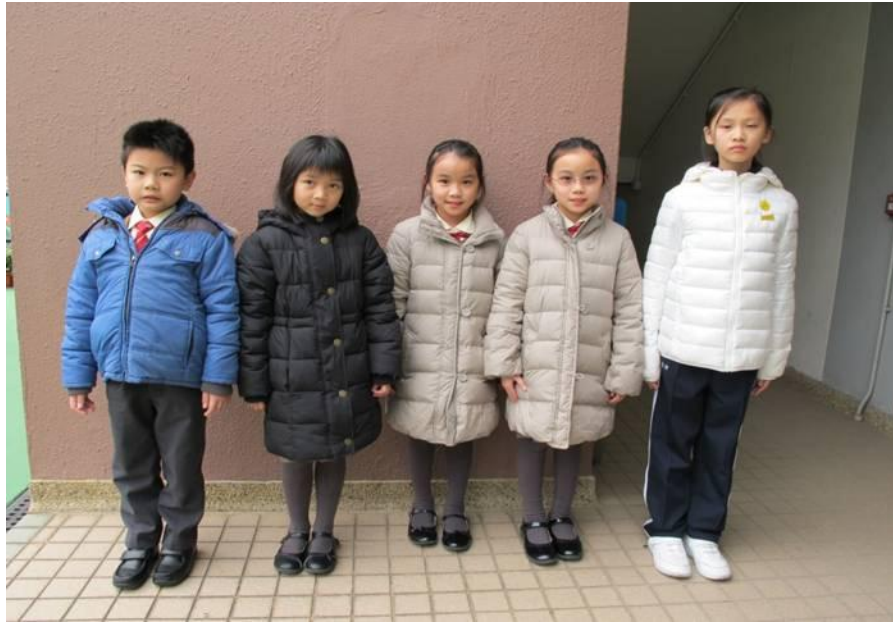
寒冷天氣警告生效時，可穿上素色(黑/藍/啡/白)厚衣保暖