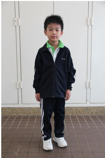
夏季運動上衣、冬季運動長褲