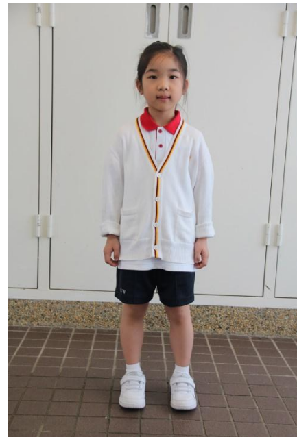
夏季運動上衣及夏季運動短褲，